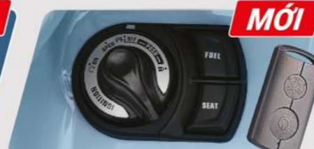
HỆ THỐNG KHÓA THÔNG MINH (Chỉ có trên phiên bản CAO CẤP & GIỚI HẠN)