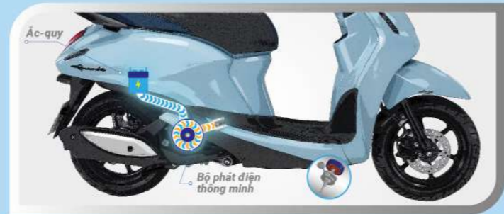
Khi xe cần hỗ trợ, bộ phát điện thông minh sẽ nhận điện năng từ ắc-quy và hỗ trợ xe tăng tốc mượt mà.