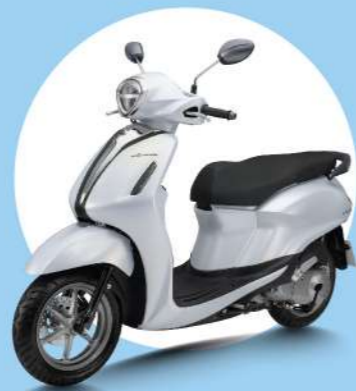
TRẮNG - ĐEN