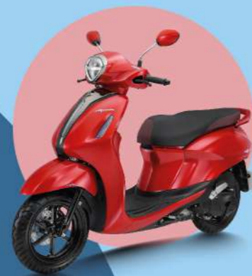
ĐỎ - ĐEN