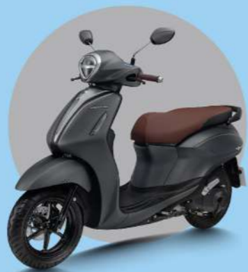
XÁM - ĐEN