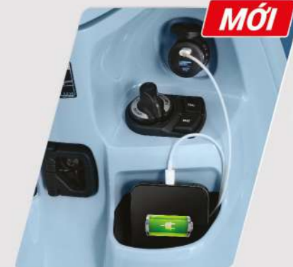
CỔNG SẠC ĐIỆN THOẠI