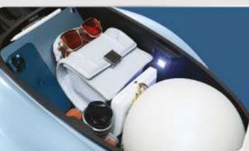
CỐC 27L CÓ TRANG BỊ ĐÈN LED