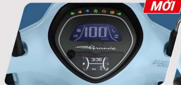
MẶT ĐỒNG HỒ ĐIỆN TỬ