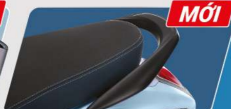
TAY NẮM SAU XE

Với nút xoay tích hợp nhiều tính năng: + Khởi động / Ngắt động cơ + Mở / Khóa cổ xe + Mở yên xe và nắp bình xăng + Định vị xe