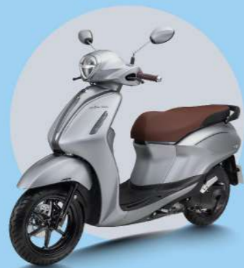
BẠC - ĐEN