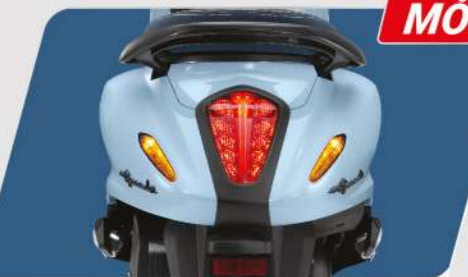
ĐÈN ĐUÔI XE