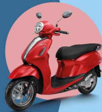
ĐỎ - ĐEN