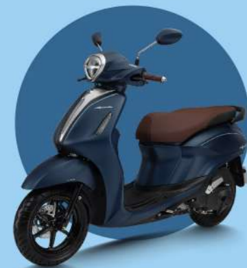
XANH - ĐEN