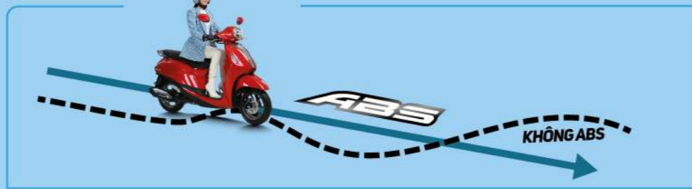
(*) Chỉ có trên PHIÊN BẢN CAO CẤP & GIỚI HẠN

Hệ thống chống bó cứng phanh ABS giúp hạn chế hiện tượng trượt bánh, đặc biệt trong trường hợp phanh gấp trên đường trơn trượt