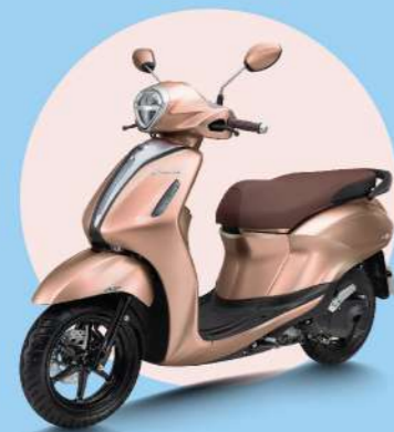
HỒNG ÁNH ĐỒNG