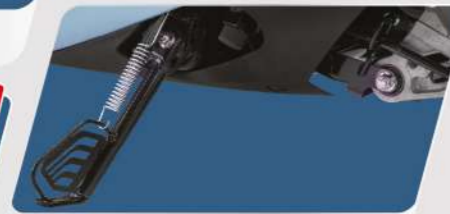
GẠT CHÂN CHỐNG ĐIỆN