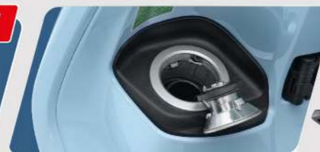
NẮP BÌNH XĂNG TIỆN LỢI