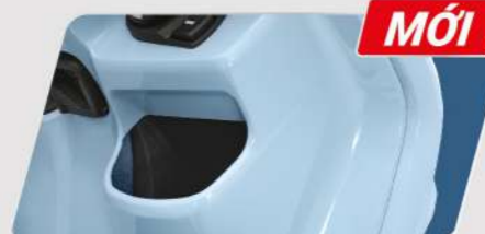
HỘC ĐỰNG ĐỒ