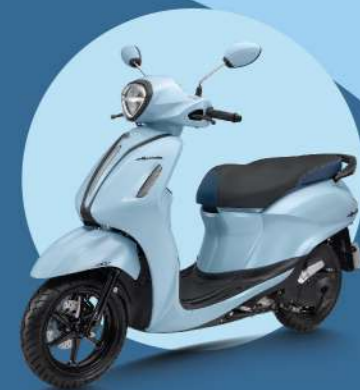
XANH - ĐEN